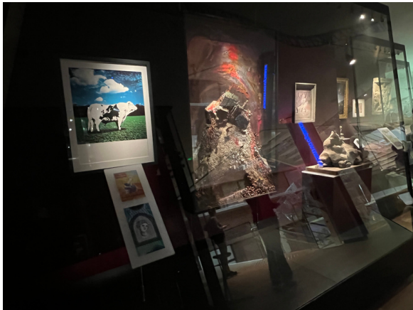
Le mythe de l'Europe

Les cinq étages du bâtiment consacrés à l'exposition permanente permettent un véritable voyage dans le temps. Les visiteurs sont d'abord emmenés au cœur de la mythologie grecque avec Europe, la princesse phénicienne qui donnera son nom à notre continent. Ainsi, vases antiques et premières cartographies tracent les contours d'une histoire que nous partageons tous actuellement